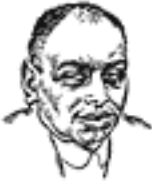
Бєля-Кун б. Председатель Совнаркома в Угорщині