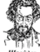
Шрайдер Председатель Революційного Трибуналу