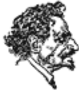
Лейба Бронштайн Троцький Міністер війни і морських сил