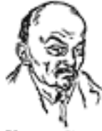
Улянов-Ленін Председатель Совіта Народних Комісарів