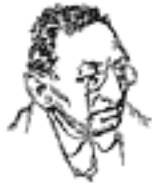
Мойше Урицький Председатель Чрезвычайки (чека)