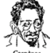
Свердлов Председатель Всеросійського З'їзду Совітів