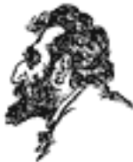
Мартов-Цедербаум б.Член Центрального Исполкома