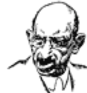
Самуїл Беркман большевицький агент в Америці